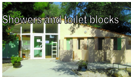
Showers and toilet blocks