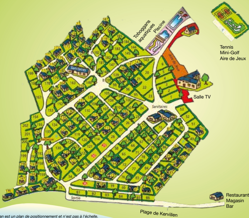
Ce plan est un plan de positionnement et n'est pas à l'échelle. This map is only for situating the pitches, and is not to scale.