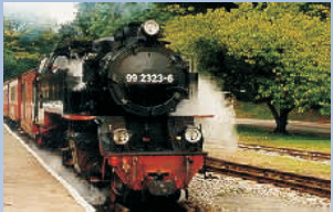
Molli-Bäderbahn nostalgische Schmalspurbahn