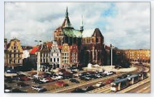
Hansestadt Rostock mit vielen Sehenswürdigkeiten