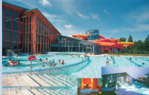
Wonnemar Wismar Spaß- und Freizeitbad