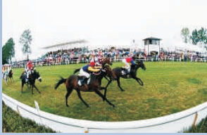
Ostseerennbahn - Europas älteste Pferderennbahn