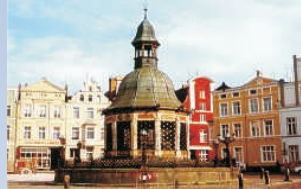
Hansestadt Wismar mit Historischer Altstadt