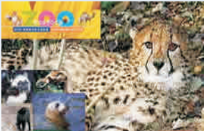
Zoo Rostock ganzjährig geöffnet