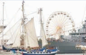
Hanse-Sail Rostock jährliches Sommer-Highlight