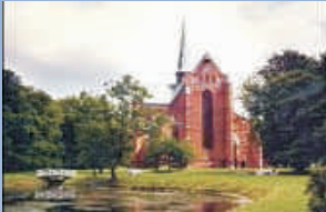
Bad Doberaner Münster bedeutendes mittelalterliches Bauwerk