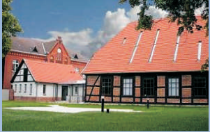
Schliemann-Stadt Neubukow Entdecker Trojas