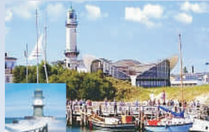
Ostseebad Warnemünde mit Teepott und Leuchtturm