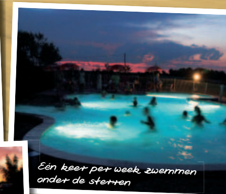
Eén keer per week zwemmen onder de sterren