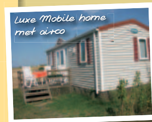
Luxe Mobile home met airco