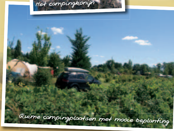
Ruime campingplaatsen met mooie beplanting