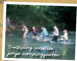
Dropping voor de jonge campinggasten