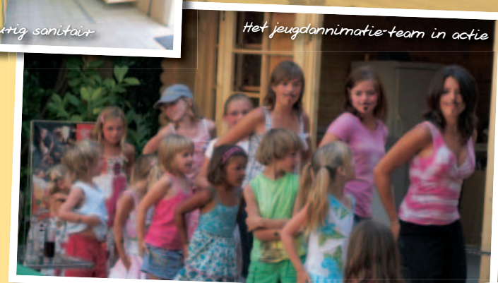
Het jeugdanimatie-team in actie