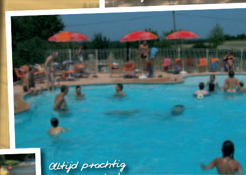
Altijd prachtig weer voor het zwembad