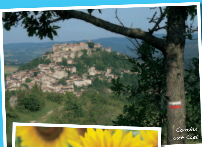
Cordes sur Ciel