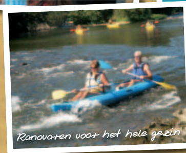
Ranovaten voor het hele gezin