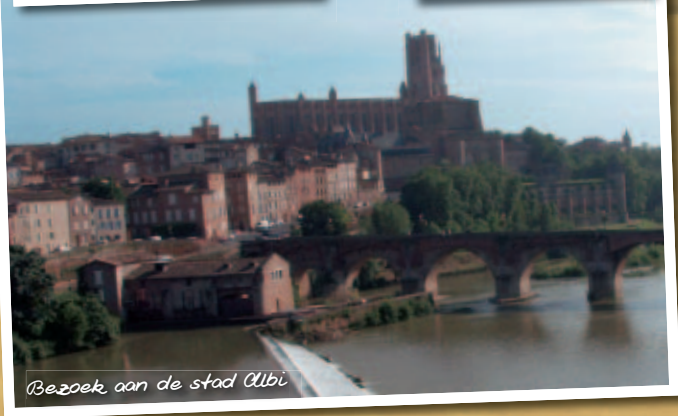
Bezoek aan de stad Albi