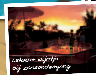
Lekker wijntje bij zonsondergang