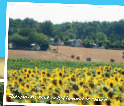
Ranperen met schitterend uitzicht